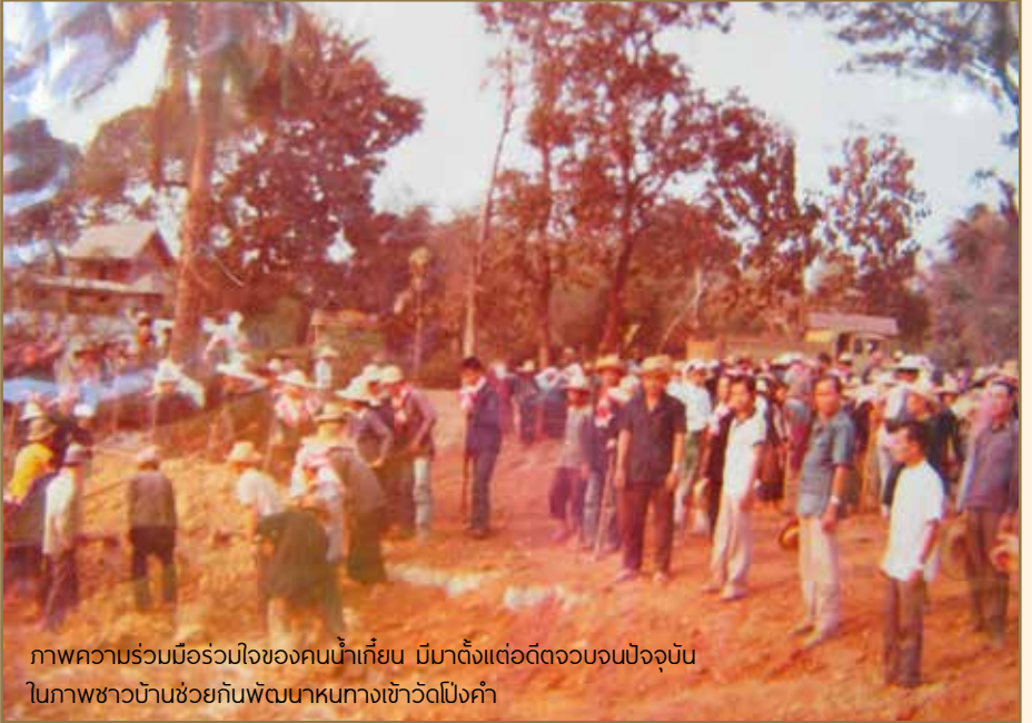
ภาพความร่วมมือร่วมใจของคนน้ำเตียน มีมาตั้งแต่อดีตจวบจนปัจจุบัน ในภาพชาวบ้านช่วยกันพัฒนาหนทางเข้าวัดโป่งคำ