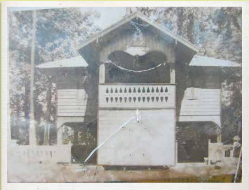
สร้างโรงเรียนแห่งแรกขึ้นภายในวัดโป่งคำ โดยมีพระเมืองคำ งานนันทไชยเป็นครูคนแรก