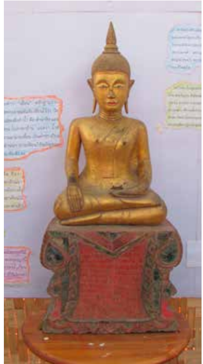
ฐานพระพุทธรูปไม้ปางมารวิชัย มีจารึกไว้ว่า “สร้างพระพุทธรูปเจ้าองค์นี้ไว้โถงกะวะระะ พุทธศาสนาวัดปลูกตอร่องน้ำเกียนนี้”

จากหลักฐานที่พบอักษรจารึกไว้ที่ ฐานพระพุทธรูปไม้ปางมารวิชัย ของวัดโป่งคำ มีจารึกไว้ว่า พระพุทธรูปนี้สร้างขึ้นเมื่อปี พ.ศ.๒๔๐๐ ถวายวัดปลูกตอร่องน้ำเกียน จึงสันนิษฐานว่า คำว่า “น้ำเกียน” เป็นคำที่ใช้เรียกลำห้วยตั้งแต่โบราณมา