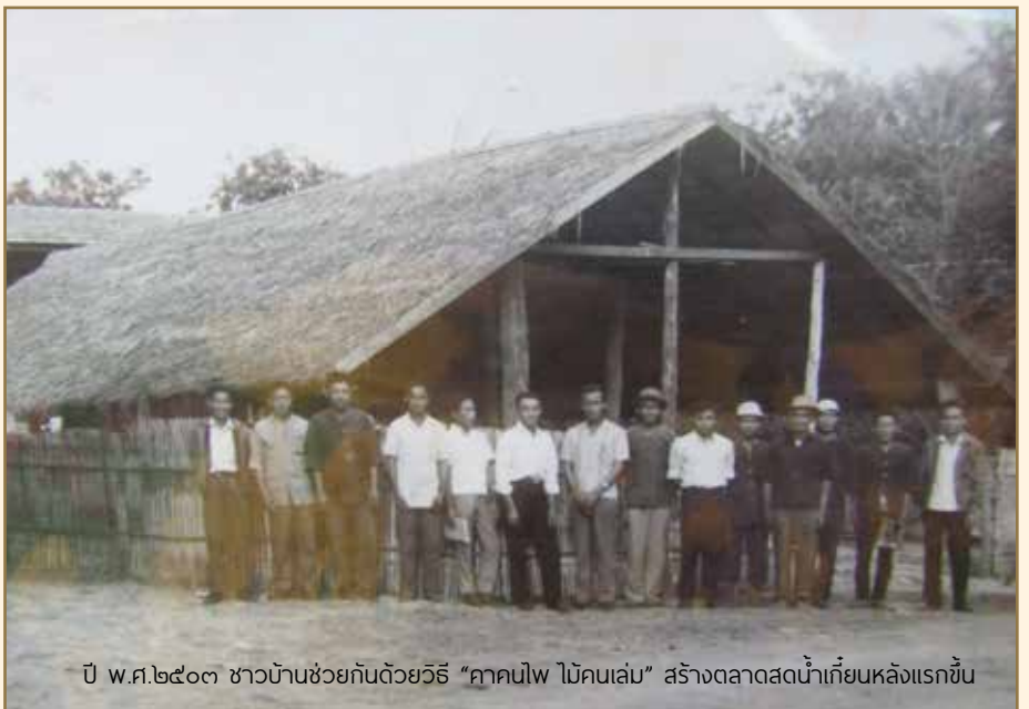
ปี พ.ศ.๒๕๐๓ ชาวบ้านช่วยกันด้วยวิธี “คาคนไฟ ไม้คนเล่ม” สร้างตลาดสดน้ำเตียนหลังแรกขึ้น